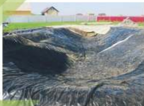
ИСКУССТВЕННЫЙ ВОДОЁМ ТЮМЕНСКАЯ ОБЛАСТЬ, П. РЕЧКИНА, 2010